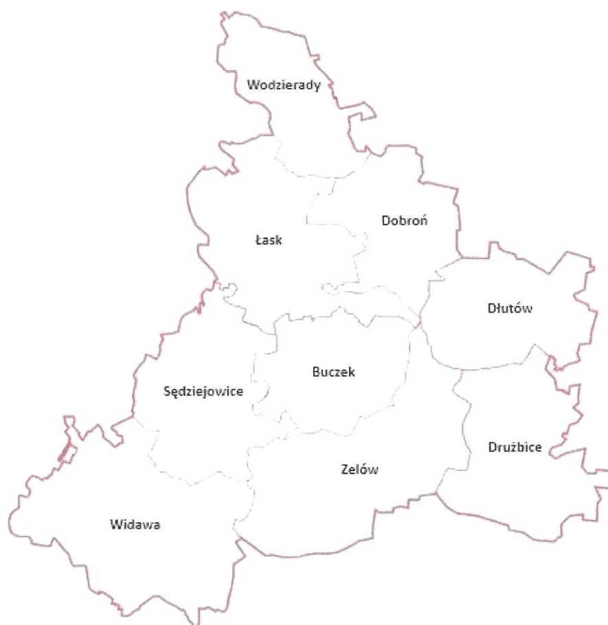
Rys. 2. Mapa obrazująca granice administracyjne LGD „Dolina rzeki Grabi”