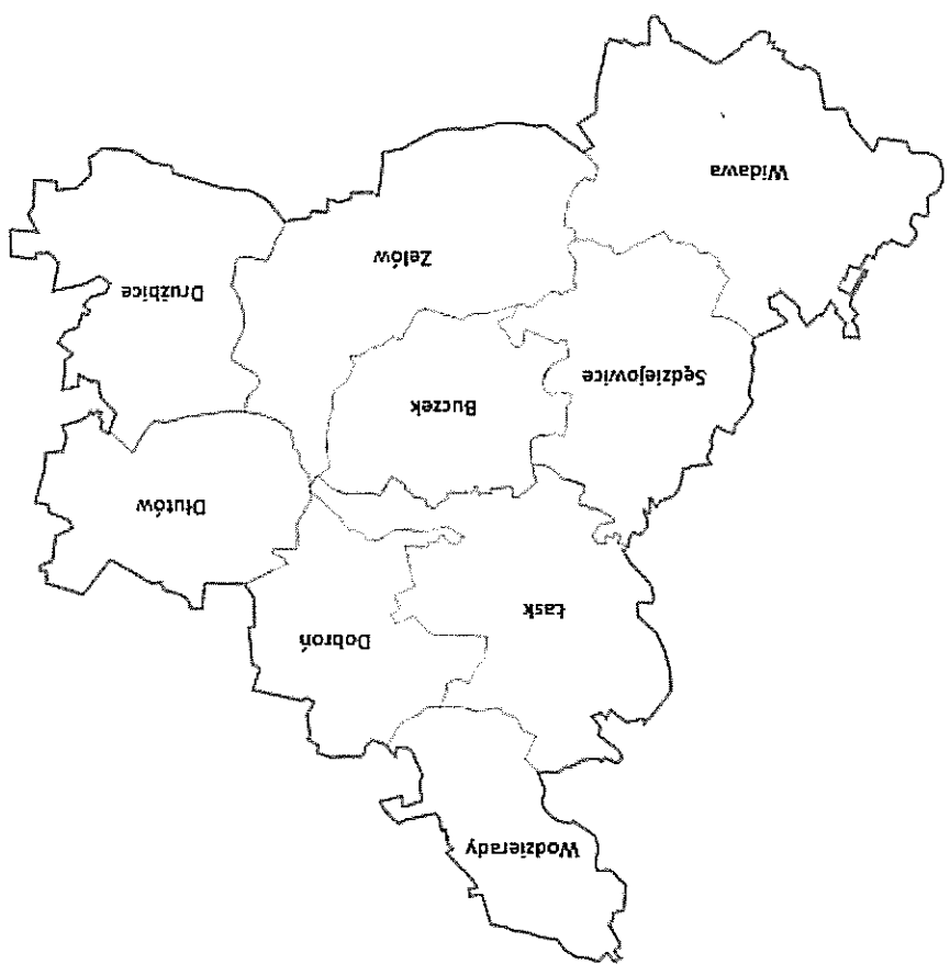
11.2. Mapa obszaru objętego LSR Rys. 2. Mapa obrazująca granice administracyjne LGD „Dolina rzeki Grabl”