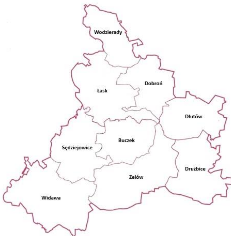
Rys. 2. Mapa obrazująca granice administracyjne LGD „Dolina rzeki Grabi”